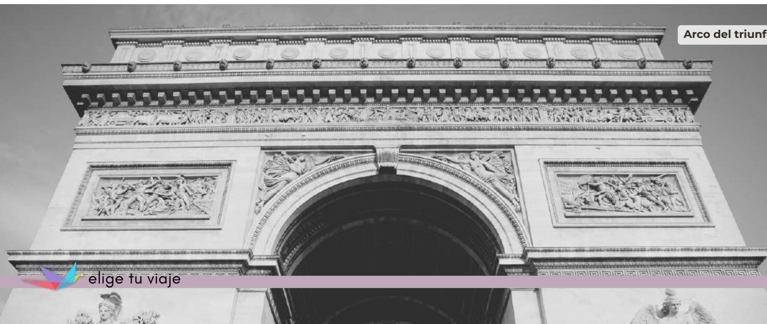
Arco del triunfo

El primer distrito es el lugar parisino "perfecto" debido a su rica historia. Contiene edificios, monumentos y restaurantes que se han convertido en símbolos mundialmente reconocidos de la ciudad. Aprovecha la oportunidad para descubrir el Quai d'Orsay, el Museo Orangerie, el Jardín de las Tullerías, la plaza Vendome, la Ópera Garnier y el Louvre (cena no incluida).